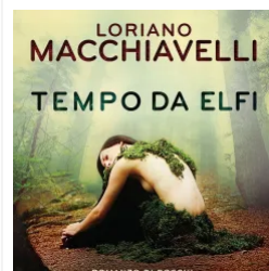
Recensione di Tempo Da Elfi –

» 66thand2nd edizioni, london voodoo orso toscos, nanga parbat orso toscos 66thand2nd, nanga parbat orso toscos alpinismo, nanga parbat orso toscos amazon, nanga parbat orso toscos lettura, nanga parbat orso toscos libro, nanga parbat orso toscos ossessione, nanga parbat orso toscos recensione, nanga parbat orso toscos romanzo, orso toscos, recensione