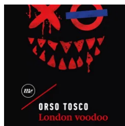
London Voodoo – Orso Tosco